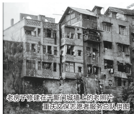
老房子修建在千厮门城墙上的老照片