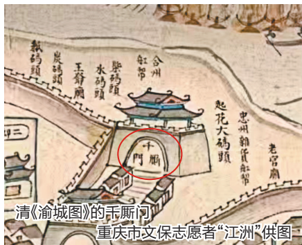
清《渝城图》的千厮门