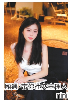
相遇·带你社交主理人 mini

从手工作坊的指尖创意到城市徒步的欢声笑语，从阅读分享的深度交流到音乐现场的律动……在重庆，青年社交生活正悄然重构，而引领这股潮流的，正是那些将兴趣转化为连接力的社群主理人。重庆晚报·相遇社交平台开启新一期主理人招募计划，正式邀请潜伏在城市里的“社交架构师”们，将你的私藏活动，变成全城的定期期待。