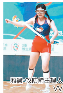
相遇·攻防箭主理人 VV