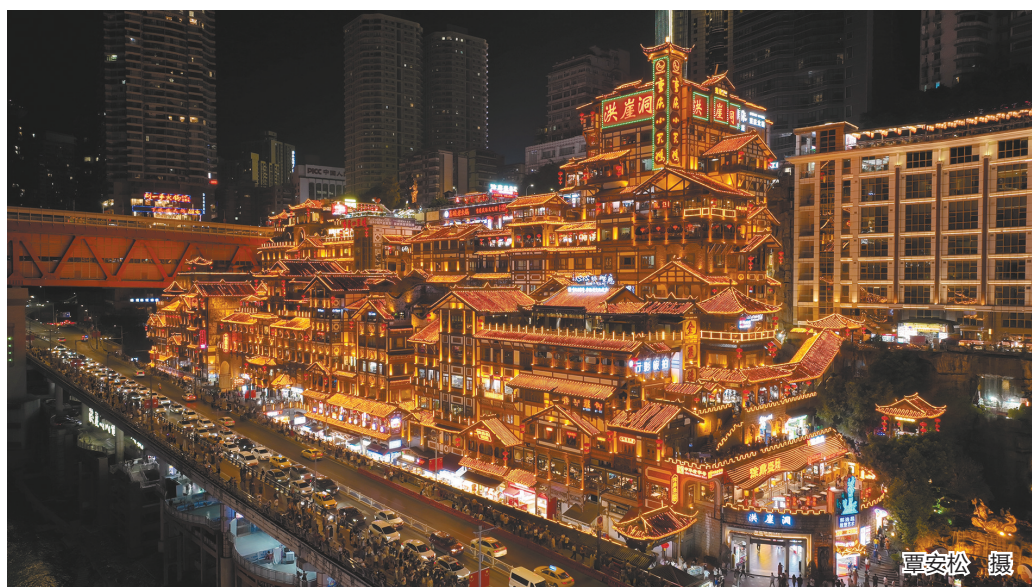
传统的光晕，在洪崖洞的飞檐翘角上流转。层层叠叠的吊脚楼被暖黄的灯光勾勒得通体剔透，宛如一座从江岸崖壁上生长出的黄金宫殿，璀璨而梦幻。

刚刚结束的跨年夜，数千架无人机在重庆的夜空编队起舞，拉开了2026年的璀璨序幕。然而，这场天空的盛宴，仅仅是“灯火重庆”的华丽一角。重庆晚报的拍客们用镜头常年见证与记录：每当夜色浸染，山城就开启一场以天地为舞台的磅礴艺术——灯火是笔，山河为卷，每晚都在书写不同的光影诗篇。