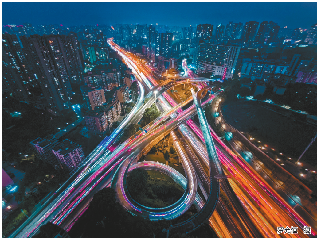
流动的光带，穿梭于城市的脉搏之中。杨公桥立交桥的曲线在夜幕下被灯光点亮，如同交织的虹霓与光练，展现出这座立体都市精妙而充满未来感的肌理。