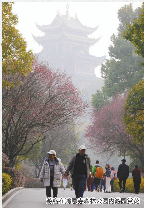
游客在鸿恩寺森林公园内游园赏花

一月的山城，寒冬中悄然绽放出一片片明媚的“粉色云霞”。近日，重庆市内多地朱砂梅、宫粉梅等竞相盛开，较往年花期提前了约半个月，为城市带来了一场意料之外的“早春秀”。为何今年梅花开得这么早？1月12日，记者就此采访植物专家。