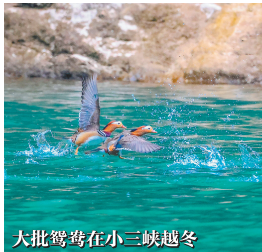
大批鸳鸯在小三峡越冬

入冬以来，巫山县生态小三峡内绿水荡漾，大批国家二级保护野生动物鸳鸯在此聚集，欢乐嬉戏。