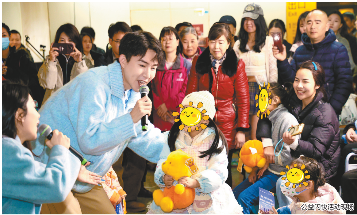
公益快闪活动现场

1月12日，重庆轨道交通两路口站内暖意涌动。由重庆轨道资源经营发展有限公司发起的“同心·听见轨道的温暖”公益快闪暨“野歌会”在此温情启幕。这场活动打破了轨道交通车站的匆忙氛围，将川流不息的出行路线转化为传递善意与温情的情感纽带，用音乐为寒冬里的山城增添了一抹暖心亮色。