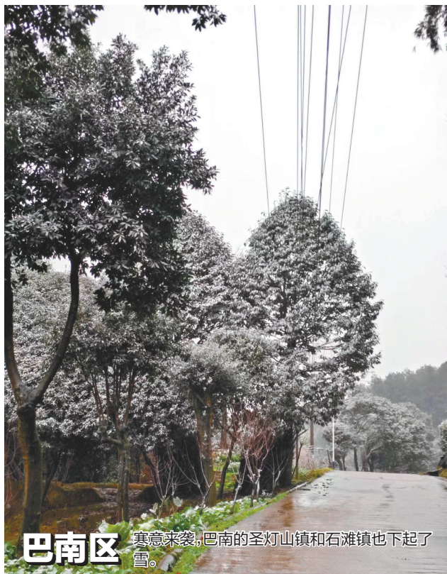
巴南区 寒意来袭,巴南的圣灯山镇和石滩镇也下起了雪。