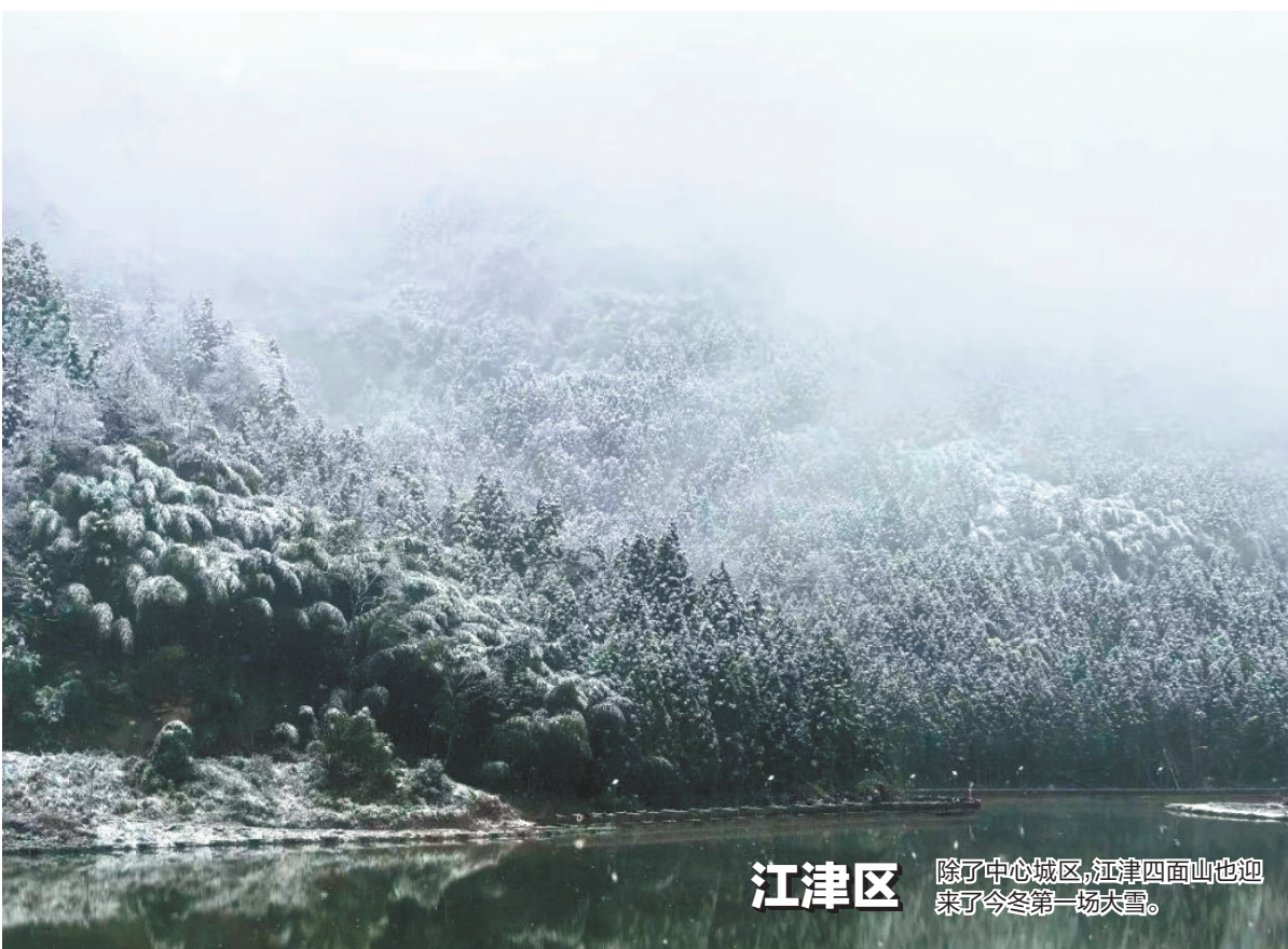
江津区 除了中心城区,江津四面山也迎来了今冬第一场大雪。