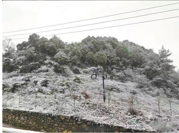
江津区 除了中心城区,江津四面山也迎来了今冬第一场大雪。