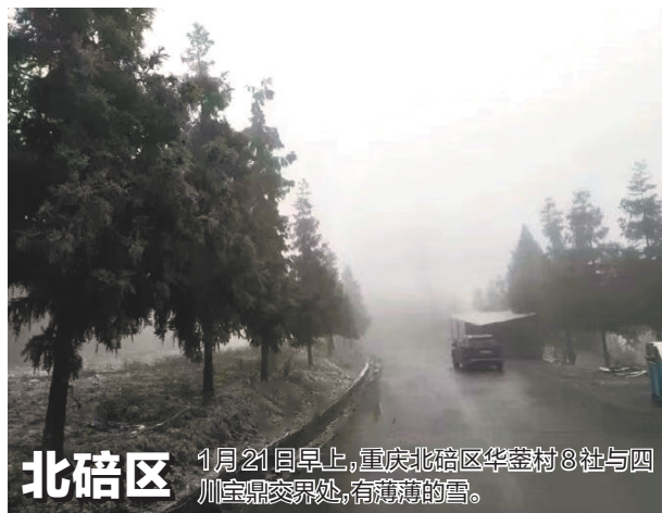
北碚区 1月21日早上,重庆北碚区华蓥村8社与四川宝鼎交界处,有薄薄的雪。