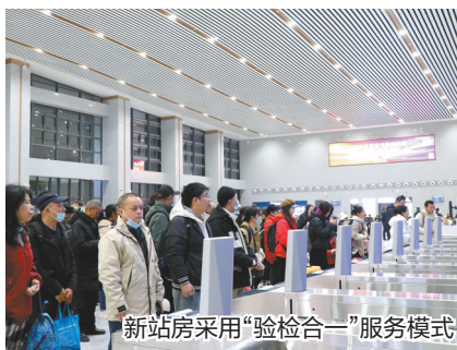
新站房采用“验检合一”服务模式