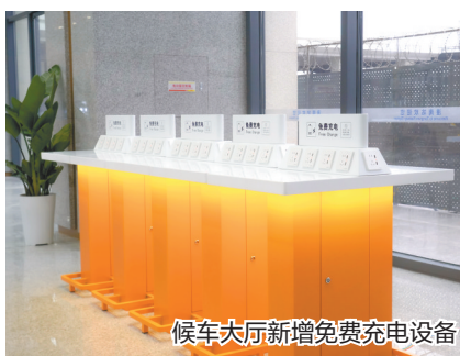
候车大厅新增免费充电设备