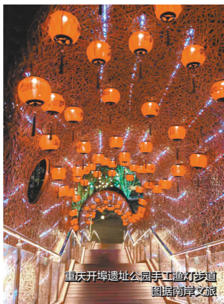
重庆开埠遗址公园手工鱼灯步道