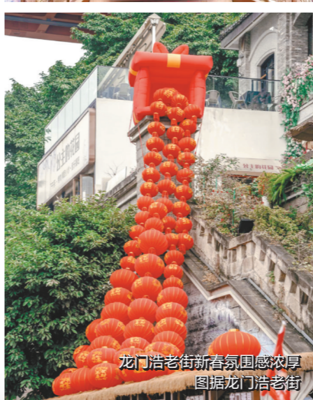
龙门浩老街新春氛围感浓厚