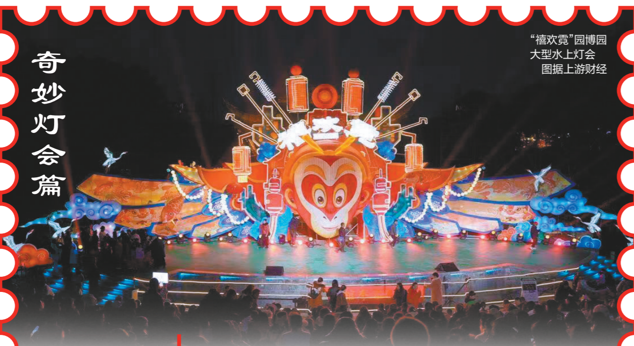
“禧欢霓”园博园大型水上灯会