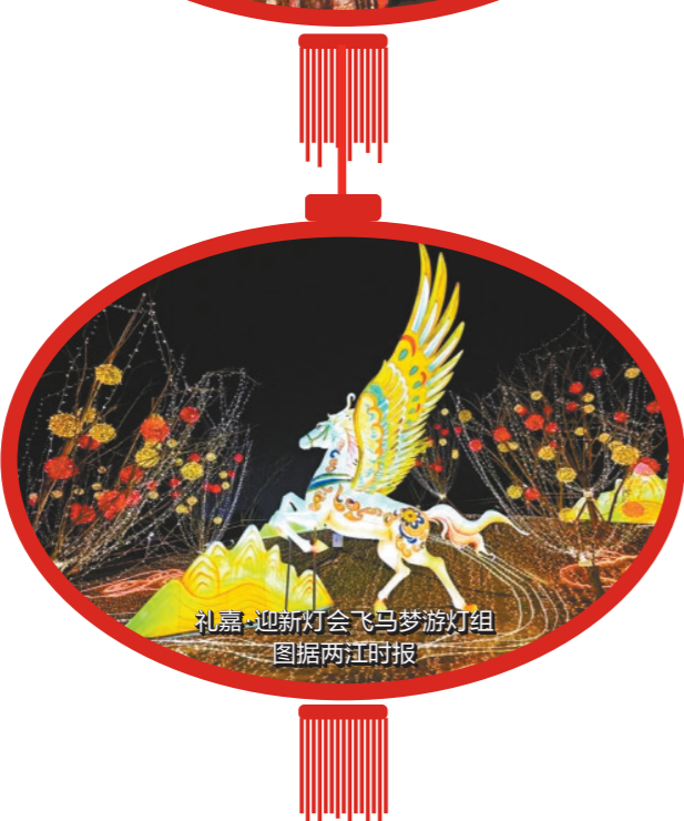
礼嘉·迎新灯会飞马梦游灯组 图据两江时报