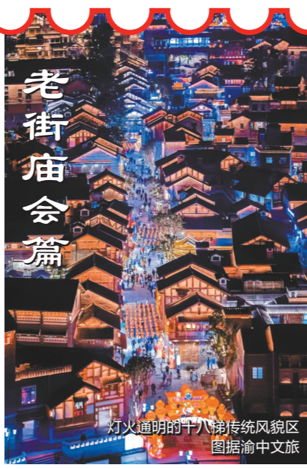
灯火通明的十八梯传统风貌区