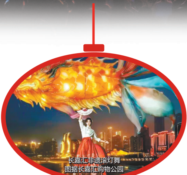
长嘉汇非遗滚灯舞