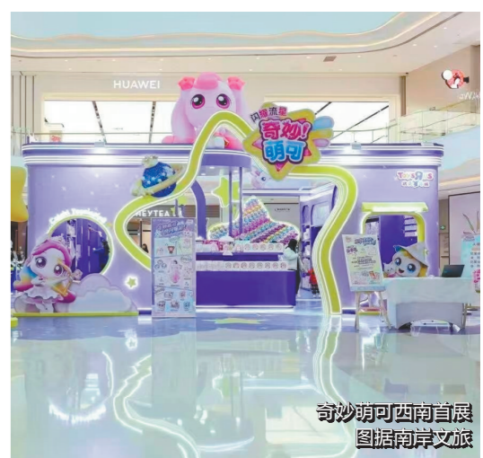
奇妙萌可西南首展

以非遗竹编工艺，将马年的生肖文化与现代艺术装置相结合，通过极具视觉冲击力的装置本身，传递“马到成功”的美好寓意。 时间：1月14日—3月3日 地点：重庆万象城L1中庭/次中庭 交通：轨道交通环线谢家湾站2号出入口，步行可达。