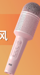
无线蓝牙家用麦克风