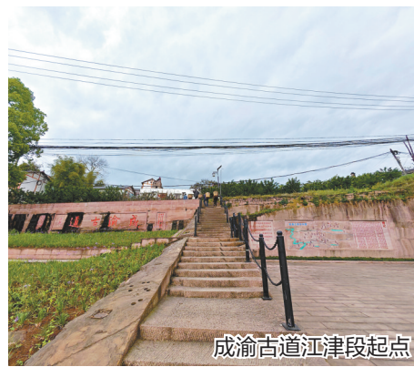
成渝古道江津段起点