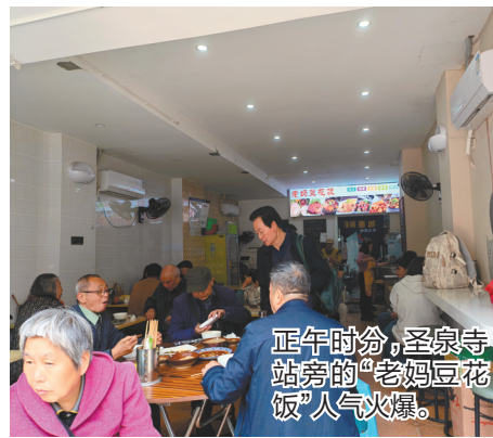
正午时分，圣泉寺站旁的“老妈豆花饭”人气火爆。