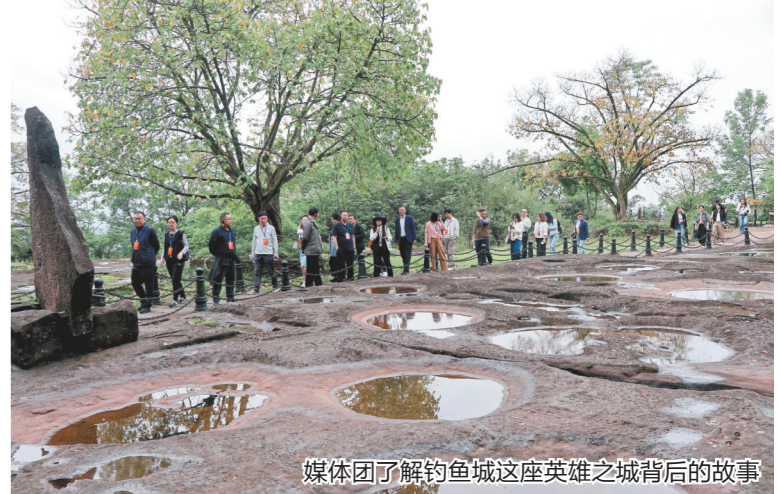
媒体团了解钓鱼城这座英雄之城背后的故事

三江潮涌，文脉绵长。媒体团认为，此次采风活动，不仅让全国晚报的媒体人零距离触摸了钓鱼城的历史肌理，更搭建起一座连接历史遗产与现代传播的桥梁。