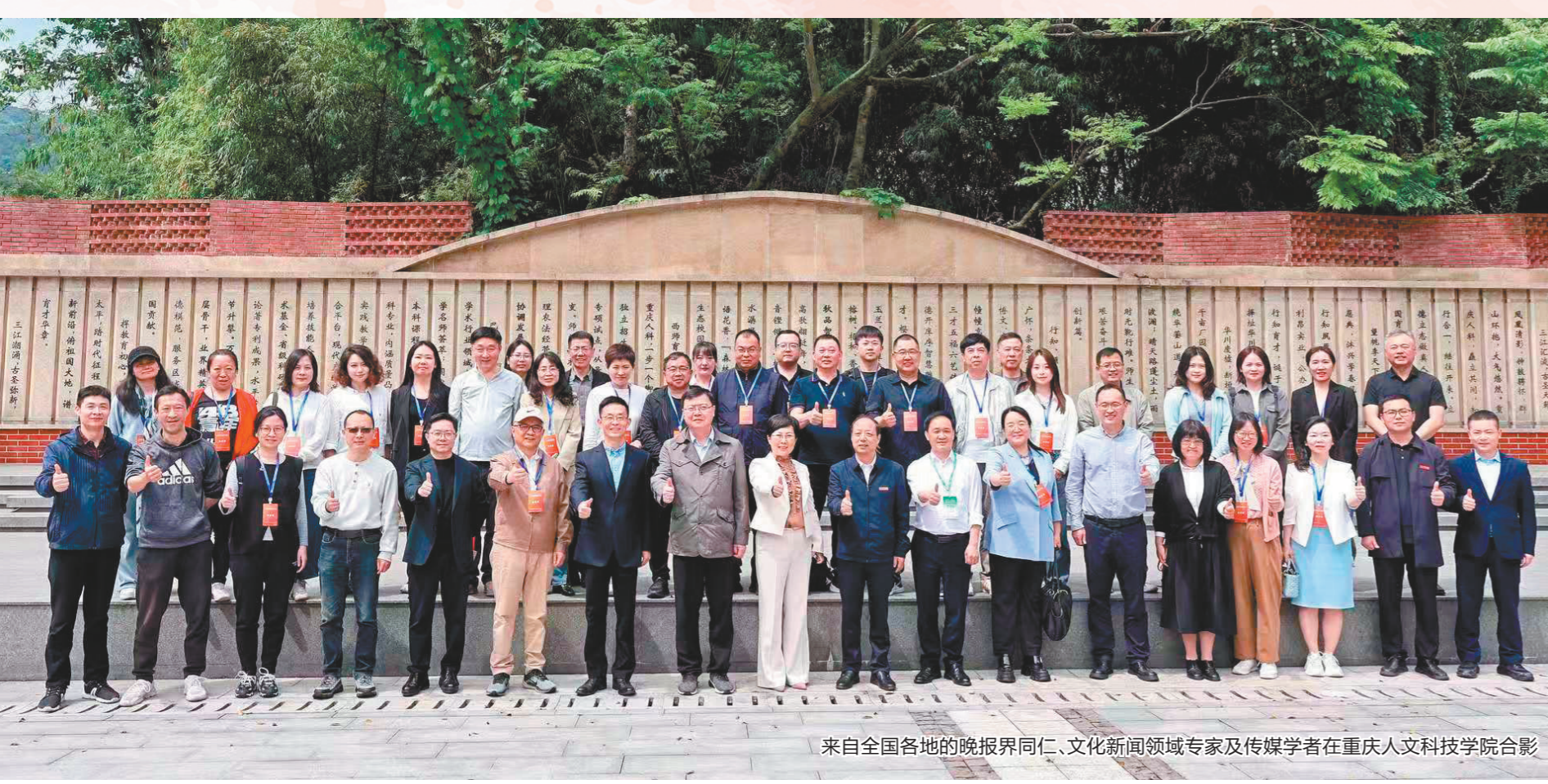
来自全国各地的晚报界同仁、文化新闻领域专家及传媒学者在重庆人文科技学院合影