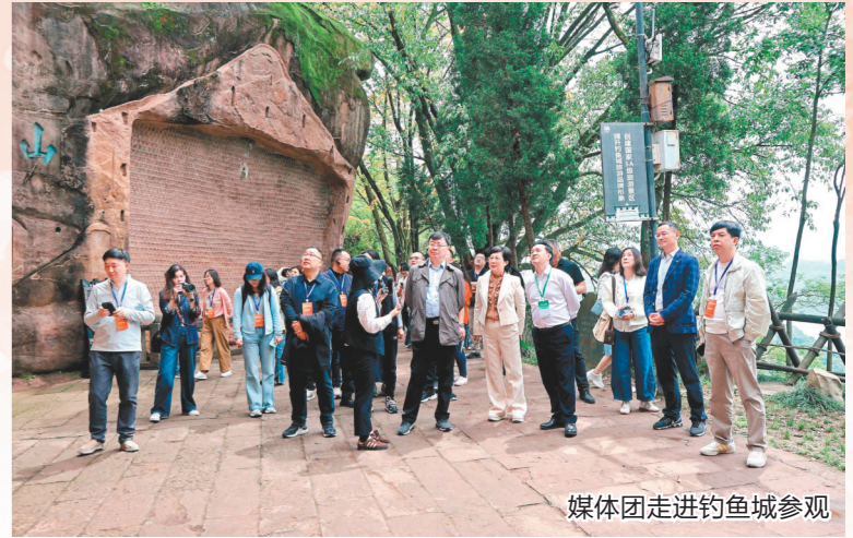
媒体团走进钓鱼城参观

4月15日上午，山城春深，嘉陵江波光潋滟。参加中国晚报协会文化新闻年会暨“全国晚报总编看重庆”活动的全国数十家晚报社长、总编辑及媒体代表组成的媒体团，走进合川钓鱼城遗址，在千年古战场之上开启了一场穿越时空的文化采风。