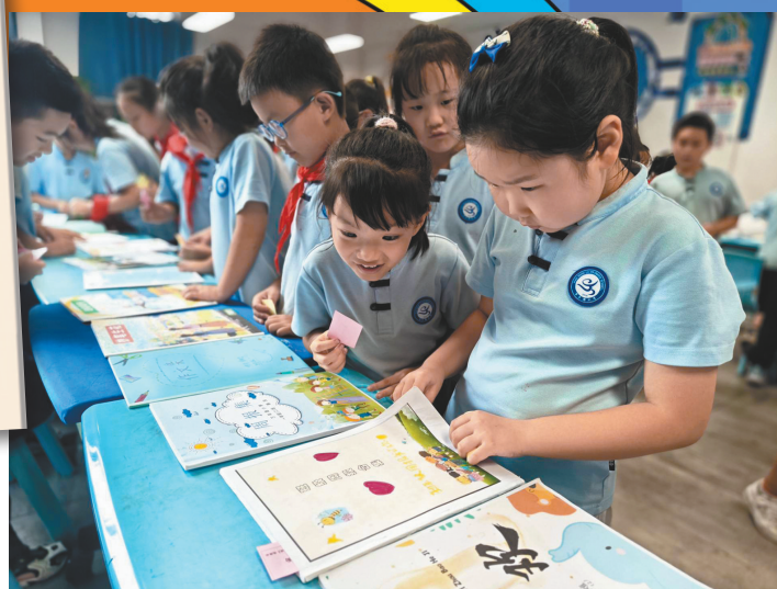
孩子们翻看装帧好的《班级周报》

未来，《班级周报》仍会一期期办下去。因为在这片尊重、开放、有文字浸润的小天地里，教育真正美好的样子，正悄然生长。而我，愿继续做那个记录者、点燃者与聆听者。