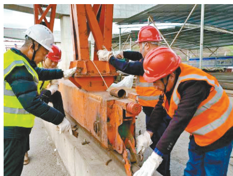
渝长一标项目开展复工安全专项行动

渝长高速复线连接道项目与内环快速路、渝航大道、南江大道、绕城高速等重要道路相交,是重庆中心城区“八横七纵九联络”快速路网中联系渝东北片区的快速通道。该项目建成后,将进一步完善快速路网,分流渝长高速交通压力,缓解弹子石、鸡冠石、唐家沱等片区交通拥堵,带动区域经济发展。