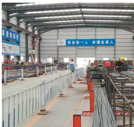
宝山嘉陵江大桥项目钢筋加工现场