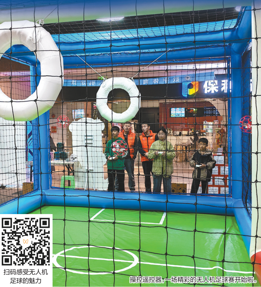
操控遥控器,一场精彩的无人机足球赛开始啦。