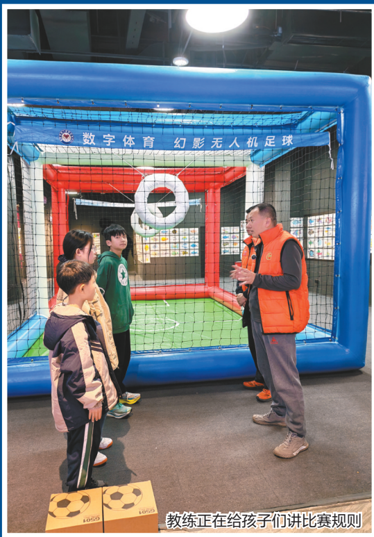
教练正在给孩子们讲比赛规则

什么?无人机还能“踢”足球?如果你看过《哈利·波特》,脑子里可能会蹦出几个字:魁地奇比赛——电影里一群魔法师骑着飞天扫帚,在空中追逐着圆球穿过圆环。而现在,这个场景正在重庆大都会广场六楼真实上演——只不过,让球飞过球门的不是魔法,而是无人机的力量。科技,让魔法照进现实。