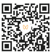
扫码感受无人机足球的魅力