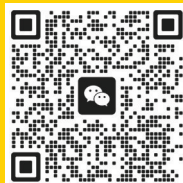
“轨道边的梦想小店” 微信群欢迎加入

如果你或身边的朋友正在轨道旁书写创业故事,欢迎推荐或自荐!让晚报全媒体的力量,为你的梦想加注动能!