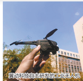
翼动科技自主研发的工业无人机