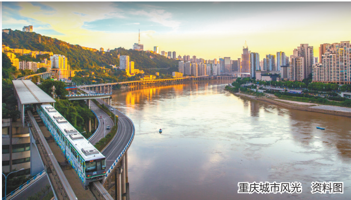
重庆城市风光 资料图

重庆是我国辖区面积和人口规模最大的城市。政府工作报告提出，要建设创新型产业社区、商务社区，推动城市治理智慧化精细化，建设现代化人民城市。