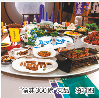
“渝味360碗”菜品 资料图