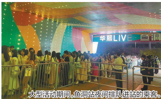
大型活动期间，鱼洞站夜间排队进站的乘客。