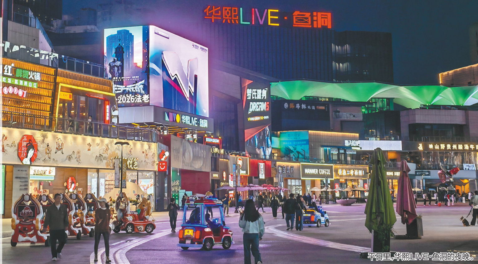
平日里，华熙LIVE·鱼洞的夜晚。

鱼洞站是重庆轨道交通2、3号线的起止站，也是人们享受夜生活的热门目的地。站外运动、娱乐、文艺、美食汇聚，勾勒出一幅鲜活滚烫、活力满满的夜生活画卷。